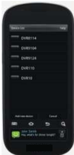
TableII-6 Device List