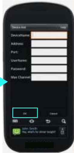
TableII-3 Device Add