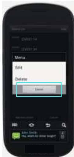
TableII-4 Device Edit