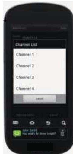
TableII-7 Channel List