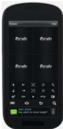
TableII 1 Start