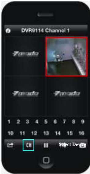
TableII-12 Channel 1