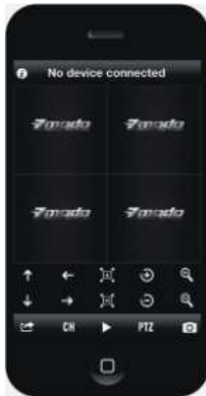
Tablet 1 Start

После загрузки программы Zviewer откроется меню управления интерфейсом: