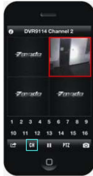
TableII-13 After switch