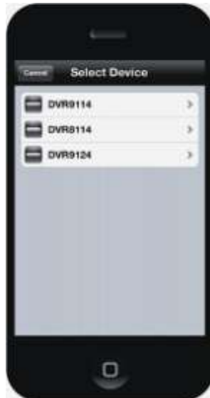
TableII-9 Select Device