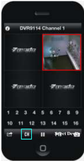
TableII-12 Channel 1