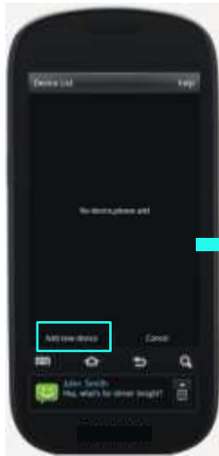
TableII-2 No Device