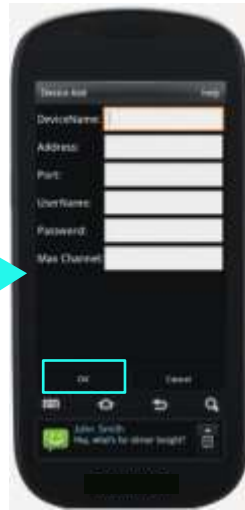
TableII-3 Device Add